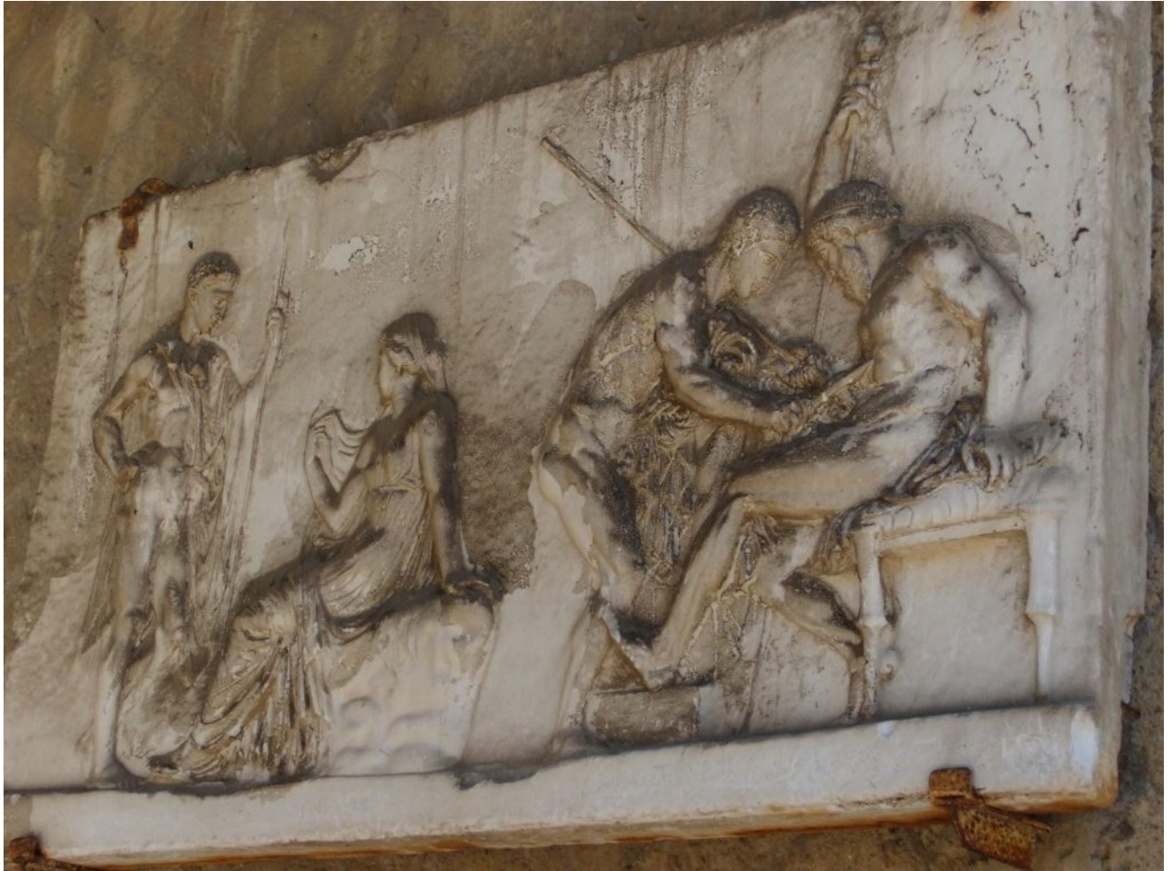
Abbildung 1 – Odysseus schabt Rost vom Speer des Achilles in die Wunde des Telephos – Relief in Herculaneum

Dieser Mythos wird von Euripides berichtet, ist aber nur noch fragmentarisch überliefert [15]. Bevor die Griechen Troja erreichten, landeten sie zu weit südlich, im Land der Mysier, kamen mit denen in ein Handgemenge bei dem Telephos, der König der Mysier, verletzt wurde. Die Griechen zogen weiter, die Wunde schwärzte. Als Telephos ratlos war, machte er das, was alle Griechen taten, wenn sie verzweifelt waren: Er sandte zum Delphischen Orakel. Das ließ ihm ausrichten: „Ho trosas kai iasetai – der, der die Wunde schlug, wird sie wieder heilen.“ Das Rätsel wurde von Odysseus gelöst. Er nahm den Speer des Achills, der die Wunde geschlagen hatte, schabte dessen Rost in Telephos' Wunde, die daraufhin heilte. Dieser Mythos war in der Antike weit verbreitet, wie das Relief, das man in Herculaneum gefunden hat, bezeugt (Abb. 1; es gibt eine ähnliche Abbildung auch auf dem Pergamonaltar im Berliner Museum, wenn ich mich recht entsinne).