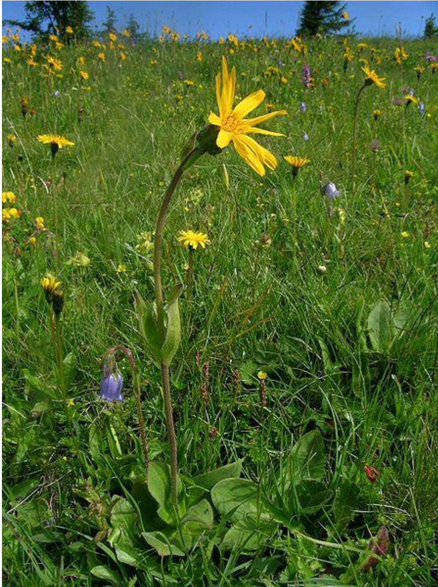
Abbildung 2 – Arnica montana

Arnika ist eine alte Heilpflanze. Man nennt sie auch das „Fallkraut“ oder das „Bergwohlverleih“. In alten Tinkturen zum Einreiben bei Schmerzen kommt es oft als Auszug vor, obwohl eine äußere Anwendung in der Regel nicht günstig ist, weil sie Hautreizungen verursachen kann. Arnica wächst in den Bergen, auf Höhen zwischen 800 und 1400 m etwa, je nach Klima. Ich habe sie dort bei Bergwanderungen des Öfteren gesehen, nicht aber in tieferen Lagen.